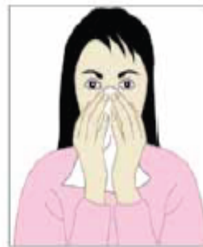
بینی و دهان خود را بپوشانید.