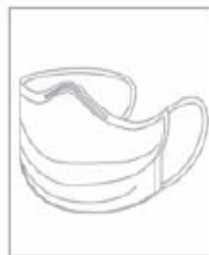
در صورتی که سرفه می کنید از ماسک طبی استفاده کنید.

انجام این اقدامات مهم برای کنترل منبع آلودگی همیشه ضروری است.